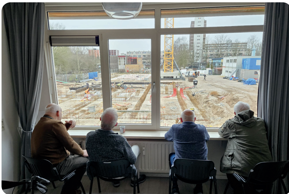
Uitzicht vanuit oude kijkwoning